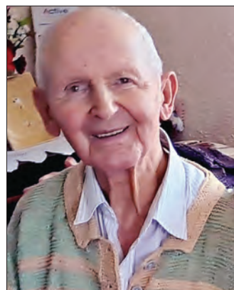
Viceprimar - Claudiu Popa