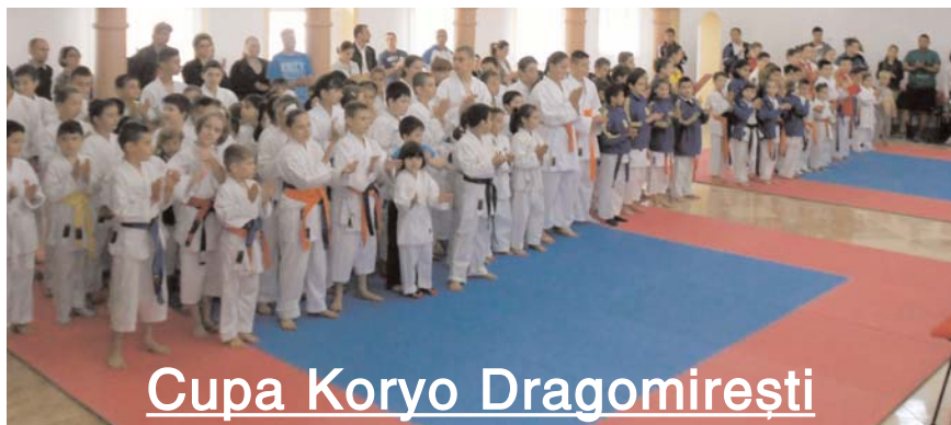
Cupa Koryo Dragomirești